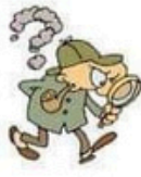
der Detektiv, -e die Detektivin, -nen