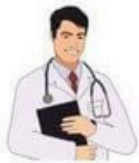
der Arzt, -e die Ärztin, -nen