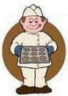
der Bäcker, -- die Bäckerin, -nen