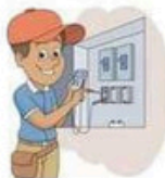
der Elektriker, -- die Elektrikerin, -nen