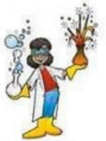
der Chemiker, -- die Chemikerin, -nen