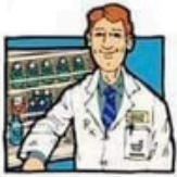
der Apotheker, -- die Apothekerin, -nen