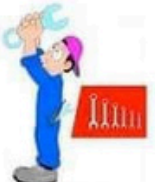
der Handwerker, -- die Handwerkerin, -nen