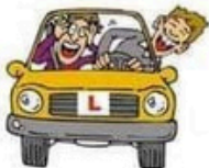
der Fahrlehrer, -- die Fahrlehrerin, -nen