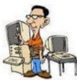
der Informatiker, -- die Informatikerin, -nen