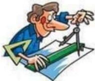
der Architekt, -en die Architektin, -nen