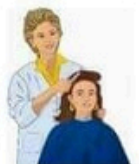
der Frisör, -e die Frisörin, -nen